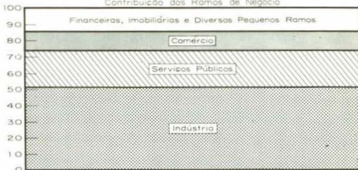
Tabela IV — Número de Sociedades — Janeiro a Dezembro 1970