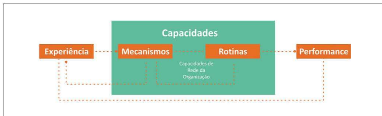
Figura 2 Processo de desenvolvimento de capacidades de aliança