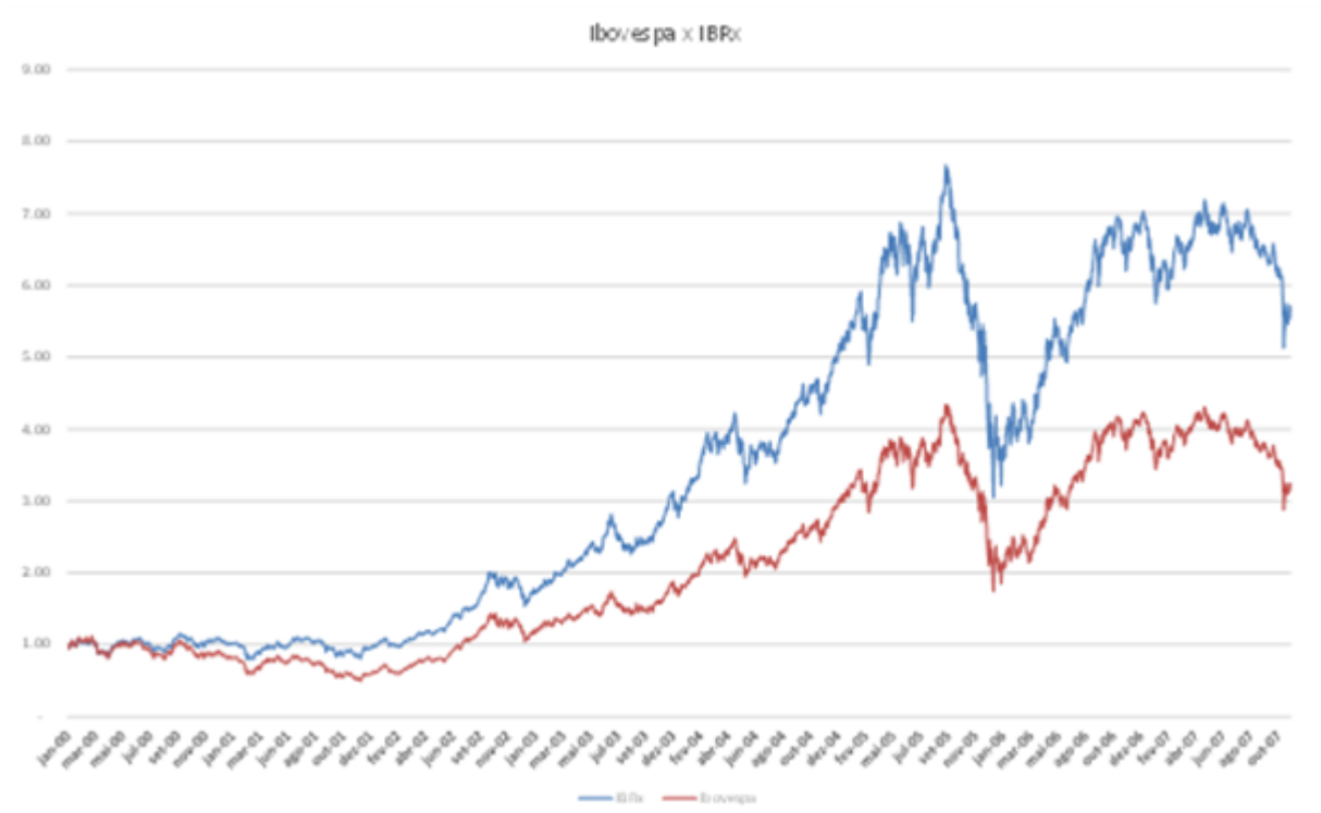
Gráfico 3: índice Ibovespa x índice IBRx

Desde 2000, o desempenho do IBRx foi superior ao desempenho do índice Ibovespa conforme podemos observar abaixo.