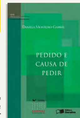
capa de Pedido e causa de pedir